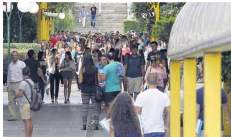
El simulacro realizado ayer en la Facultad de Economía. ✉ MARIO ROJAS

«Todo fue bastante mejor de lo esperado, aunque todavía quedan cosas por mejorar», admitía el decano. Y, por eso, ahora será la empresa encargada de elaborar el plan que emita un informe con los fallos que hay que subsanar, porque «la