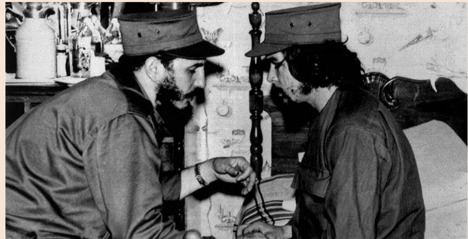
LAS BODEGAS ESPAÑOLAS Muchos emigrantes españoles compraron casas y abrieron bodegas (tiendas de ultramarinos) en Cuba. A la izquierda, bodega de unos emigrantes asturianos en el municipio de Marianao. Lo perdieron todo con la revolución castrista. Sobre estas líneas, Fidel Castro, a la izquierda, conversa con Ernesto 'Che' Guevara en enero de 1959.